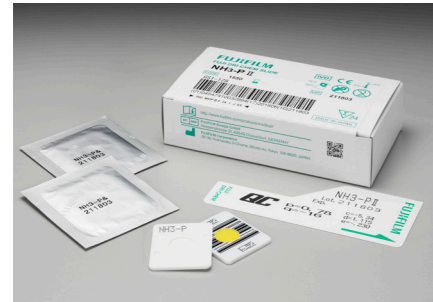
NH 3 -P II