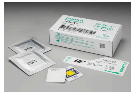
NH 3 -W II