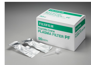
PLASMA FILTER PF