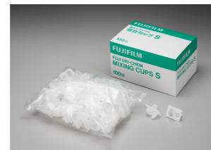
MIXING CUPS S